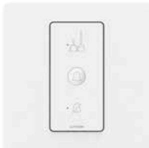
Affichage Couloir avec bouton sonnette*