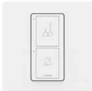
Nettoyer la Chambre / Ne Pas Déranger*