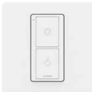
Commande générale On/Off