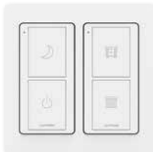
Luci accanto al letto e tende esempio 1