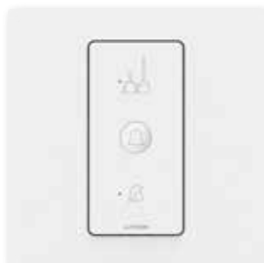
Indicatore per il corridoio/ Campanello*