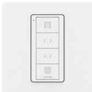
Tende aperto/Regolazione personale/Chiuso