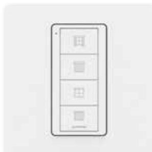
Sipari & Tende aperte/chiuso