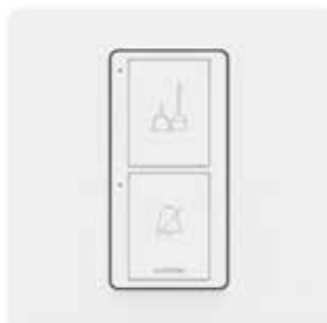
Pulizia della stanza e privacy*