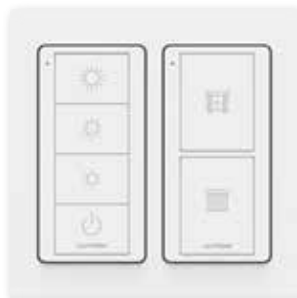
Luci accanto al letto e tende esempio 2