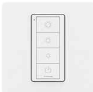
3 scene + Off