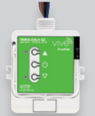
Controles de carga inalámbricos