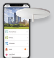
Software opcional para instalaciones