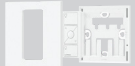
Controles de pared